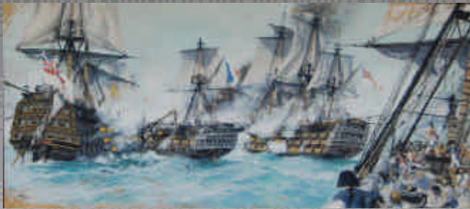
Albert BRENET. Trafalgar. Gouache signée. 70x180 cm.