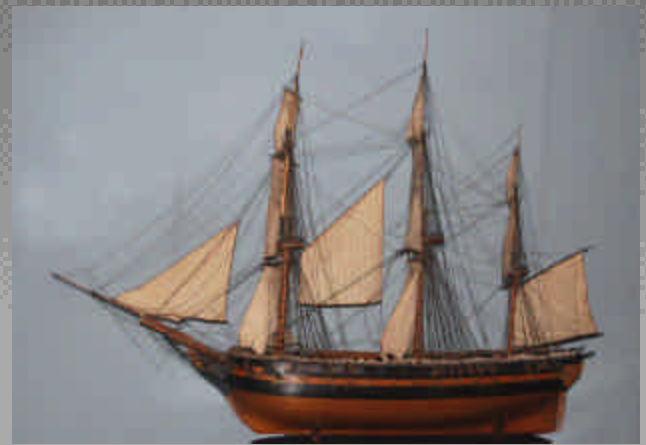
Charlotte. Modèle d'arsenal. Clermont-Tonnerre, 1827. 135x185 cm.