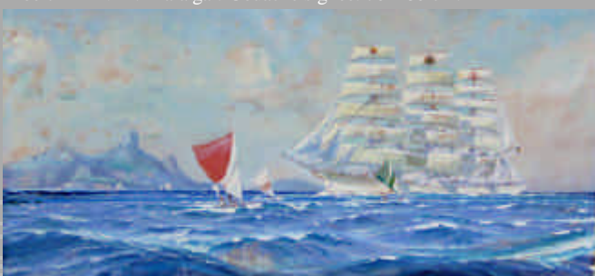
MARIN-MARIE. L'Avenir. Gouache signée. 75x167 cm.