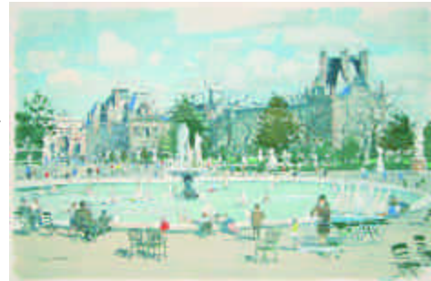
217. Léon HAFFNER et P. FRAISSE (graveur). Régate. Médaille en bronze doré du Club Nautique de la Croisette en hommage à François Périsse. 1947. Diamètre : 8 cm. 150/200 e