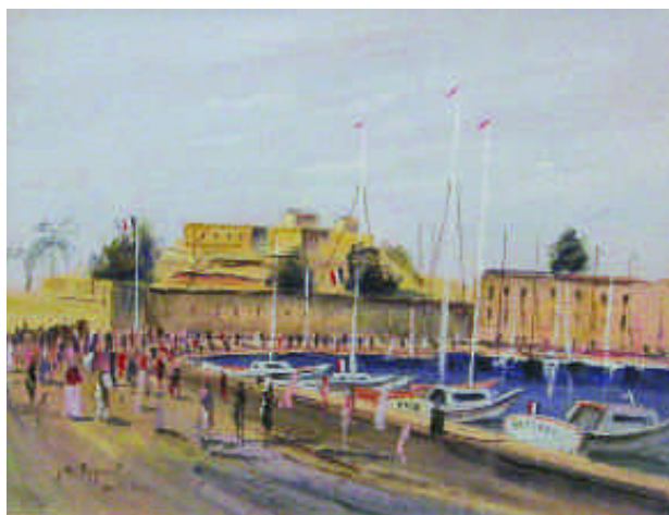
163. NOQUET J. M. Le port d'Antibes. Gouache signée en bas à droite. 26 x 34 cm. 600/800 e

F ranck BOGGS (1855-1926), né dans l'Ohio, arrive en France en 1876 et étudie la peinture aux Beaux-Arts dans l'atelier de Gérôme à Paris. Peintre de paysages impressionnistes, il fut l'ami de Vincent Van Gogh. Honfleur le compte parmi ses peintres.