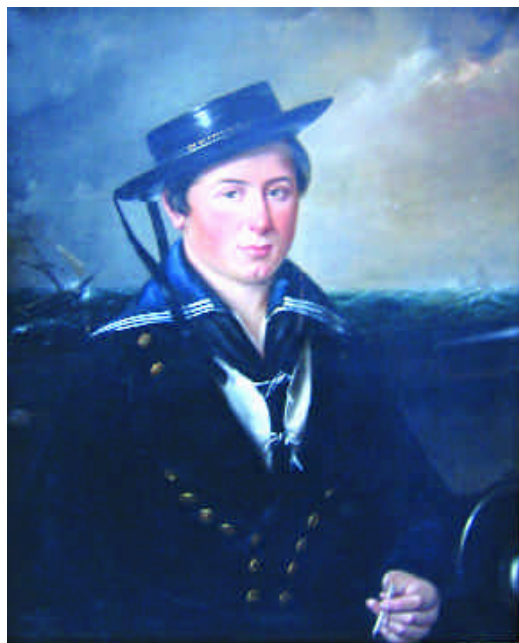
87. Ecole française 19 ème siècle. Portrait d'un aspirant. Huile sur toile vers 1860/1870. 80 x 64 cm. 3 000/3 500 e