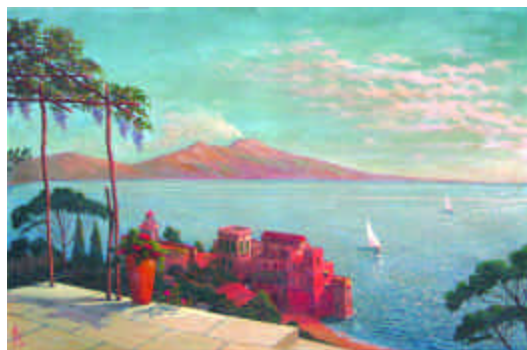
129. HUET P. La baie de Naples. Huile sur toile signée en b. à d. 63 x 99 cm. 3 500/4 000 e