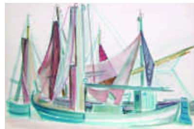
12. CLUSEAU-LANAUVE Jean. Le thonnier. Aquarelle, cachet d'atelier. 49 x 62 cm. 150/200 e