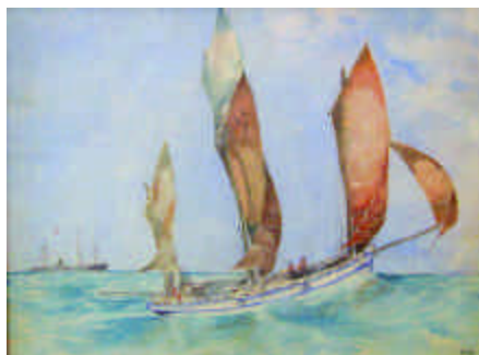
175. SANIER Albert. Le bateau pilote LR 3 de La Rochelle. Aquarelle monogrammée AS en bas à droite. 41 x 55 cm. 350/400 e