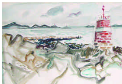
10. CLUSEAU-LANAUVE Jean. Ile de Batz. Aquarelle, cachet d'atelier. Daté 1953 au dos, 37 x 52 cm. 150/200 e