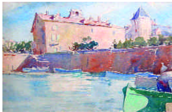
164. MARIN-MARIE. Saint-Jean-de-Luz, le port et la maison de l'Infante. Aquarelle signée en b. à d. 31,5 x 56 cm. 8 000/10 000 e