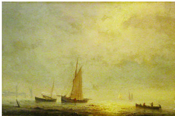
154. GILBERT Pierre J. Retour de pêche. Huile sur panneau signée et datée 1850. 23 x 35 cm.