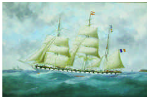
97. ADAM Edouard. La Jeanne d'Arc sortant du Havre. Huile sur toile signée en b. à d. 59 x 90 cm. 5 500/6 000 e