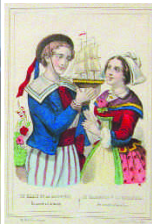
88. "Le marin et la marinière". Lithographie en couleur par Pellerin à Epinal. 25 x 17,5 cm. 150/200 e