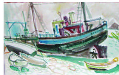
14. CLUSEAU-LANAUVE Jean. Bergen. Aquarelle avec cachet d'atelier en b. à d. 42 x 55 cm. 150/200 e