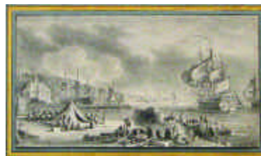
177. OZANNE Pierre ou Nicolas. Port animé. Dessin et gouache blanche signé en b. à g. 24 x 33 cm. 4 000/4 500 e