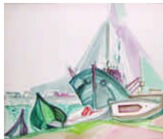
11. CLUSEAU-LANAUVE Jean. Bateau de pêche. Aquarelle, cachet d'atelier. 36 x 56 cm. 150/200 e