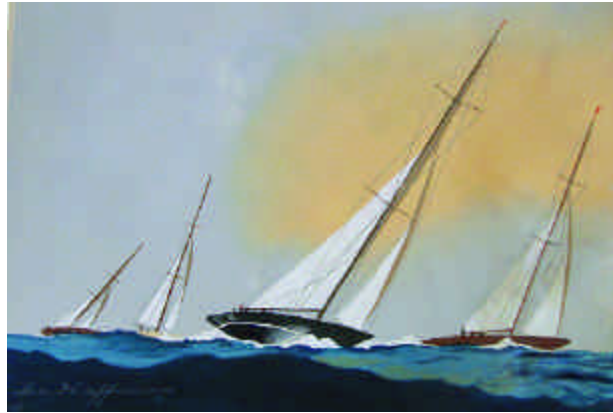
214. Léon HAFFNER. Régate. Gouache au pochoir sur papier signée et numérotée 147 en bas à gauche. 31 x 43 cm. 600/800 e