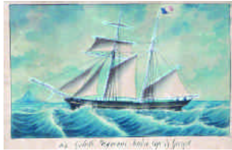
168. Ecole française 19ème siècle. La goélette Seudre, Capitaine Georget. Aquarelle datée 1867. 19 x 28,5 cm. 500/600 e