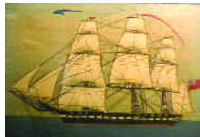
103. MARIN-MARIE. Tois-mâts Bordes et thonier. Procédé Jacomet. 19 x 24,5 cm. 300/400 e

M aurice MELISSENT (1911-1988). Peintre et illustrateur Havrais. Peu d'oeuvres dans le commerce et peu connu pour n'avoir jamais exposé. Un ouvrage récent sur son oeuvre : "Tous les paquebots du monde" J.P. Ollivier et P. Valetoux.