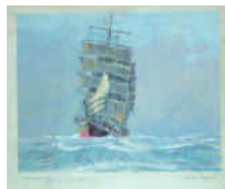
98. MARIN-MARIE. Trois-mâts sous grande voile. Reproduction signée en b. à d. avec envoi. 46 x 59 cm. 1 000/1 200 e