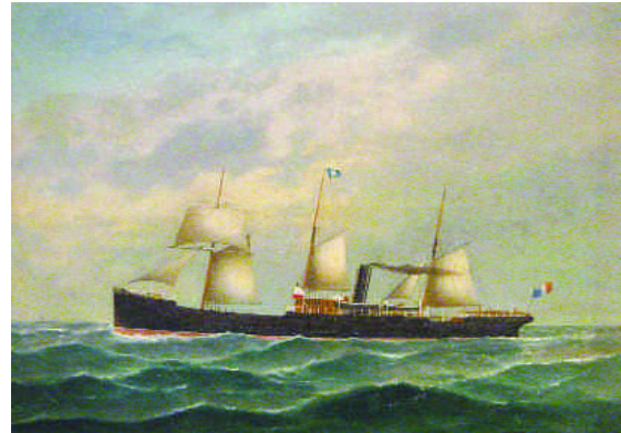
170. PETERSEN et HOCH. Le Frederick Franck, trois-mâts mixte. Huile sur toile signée et datée 1882. 46 x 63 cm. 3 000/3 500 e