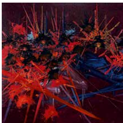
Georges MATHIEU (1921-2012) Adjugé 73 000 €