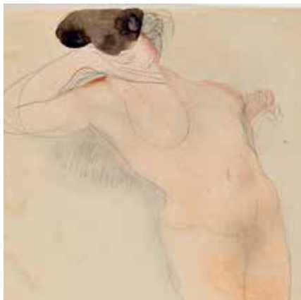
Auguste RODIN (1840-1917) Adjugé 36 000 €