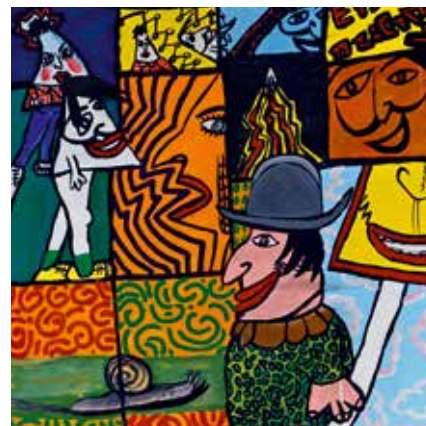
Robert COMBAS (né en 1957) Adjugé 28 000 €