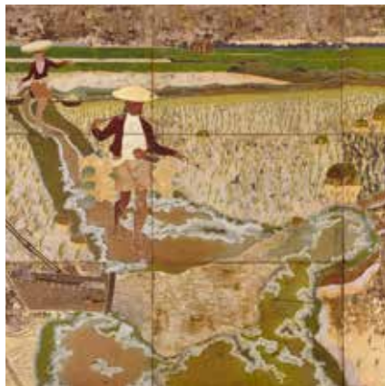
École des Beaux-Arts de l'Indochine (1925-1945) Adjugé 100 000 €