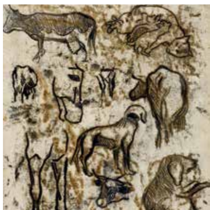
Paul GAUGUIN (1848-1903) Adjugé 20 000 €