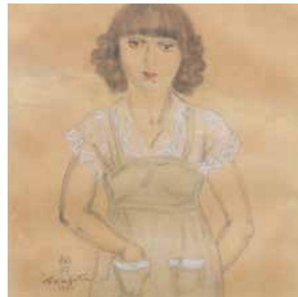
Léonard-Tsugouharu FOUJITA (1886-1968) Adjugé 60 000 €