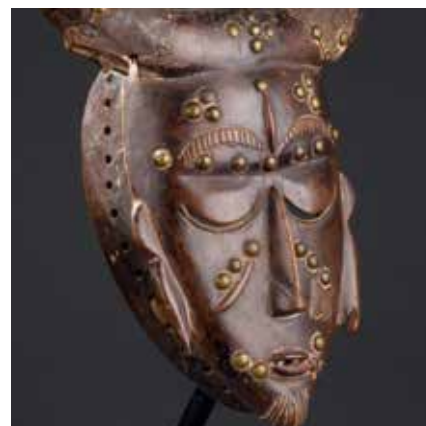
Masque Ligbi Adjugé 33 000 €